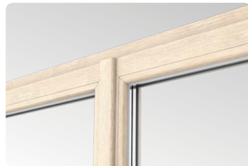
Schlanke Profile mit schmalem Stulp (112 mm) und doppelter Dichtung – eine Neuheit unter den Lösungen dieser Art auf dem Markt.