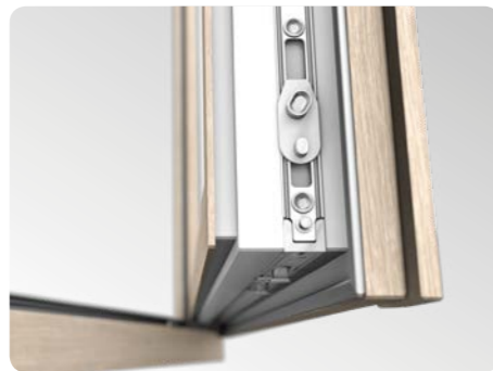
Hochwertige Profile von optimaler Konstruktion und moderne Beschläge mit einem mittig auf dem Stulp angebrachten Getriebegriff.