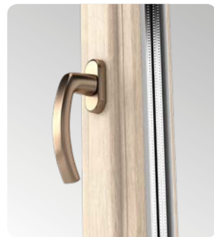
Der elegante Aluminiumgriff unterstreicht des Fensters.

Das große Farangebot an Renolitfolien ermöglicht eine beliebige Raumgestaltung innen und die Anpassung der Fenster an die Gebäudeoptik außen.